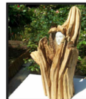
JL Monsieur Legrand