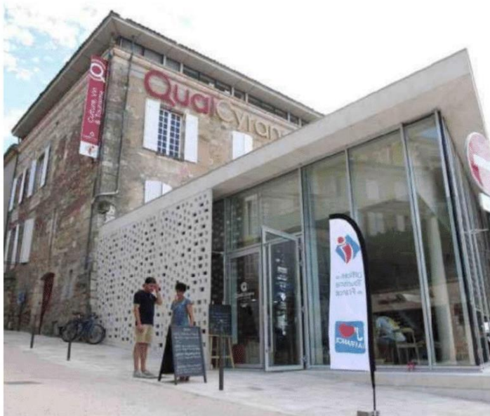
Une scénographie consacrée à Cyrano sera aménagée à l'étage du Quai Cyrano.

Au passage, Frédéric Delmarès fixe les ambitions de l'Agglomération dans le sillage de Bordeaux la gestionnée : « positionner la CAB comme une alternative à la métropole bordelaise. On parle d'économie pendulaire, c'est-à-dire se loger à une heure du boulot avec la possibilité de bâtir une maison pour sa famille ou d'en acquérir une, avec une autre qualité de vie, un autre rythme, mais avec des services de qualité, de loisirs, de culture, de santé, de sport, d'éducation, d'excellence alimentaire. »