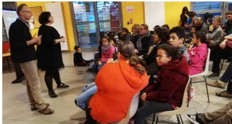
Au centre social de la Brunetière, mercredi dernier, le théâtre de la Gargouille présentait son projet de « quartiers en scène », avec l'espoir de susciter des idées chez les habitants.

La méthode se veut « inédite en France » : la CAB a engagé la « rédaction de son projet culturel » sur ces nouvelles bases, qui intègrent à la culture avec un grand C « les lan-