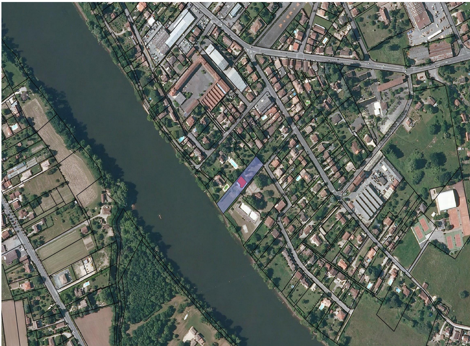
Annexe 1/1 Plan du Périmètre Délimité des Abords de la maison Pic sur la commune de Bergerac