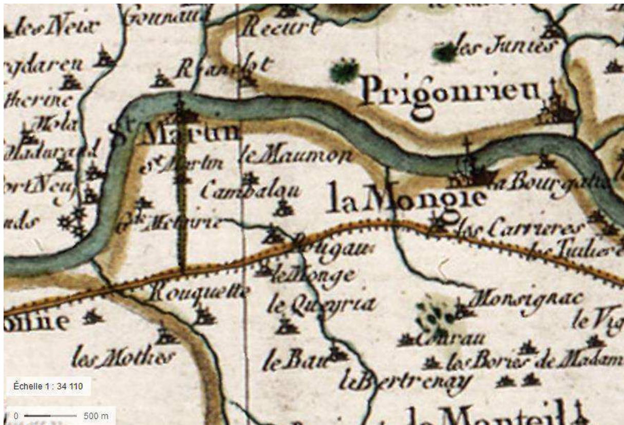
(Carte : Carte Etat-Major XIX e siècle / géoportail)

Ce repaire noble fut construit au XVI e siècle en y incorporant un donjon carré plus ancien. La famille de Bérail occupa le fief, il passa ensuite aux Vigier puis aux Flammarens. Au début du XIX e siècle, le général comte Boudet, valeureux officier de l'Empire, acquit la demeure et la restaura. Elle appartient encore à ses descendants.